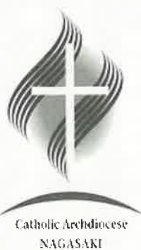
Catholic Archdiocese NAGASAKI

委員会としては、今後は役割分担をして、それぞれの部会に専任者を当てたうえで、修道者や信徒の協力を求めながら活動を深めていけたらと希望しています。